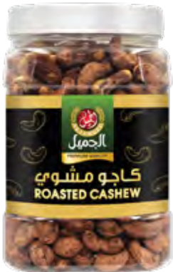
كاجو مشوي Roasted Cashew Origin: USA

١٠ x ٥٠٠ ج الكرتون ٥ كيلو 500g x 10g CARTON 5Kg