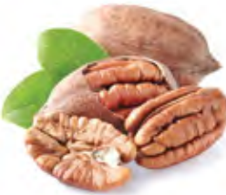
Pecan بيكان Origin: U S A, Argentina