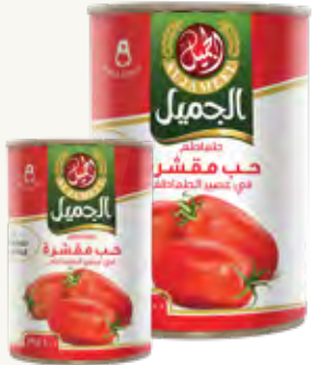
طماطم مقشرة Tomato Plum Origin: Itali

٤٠٠ ج x ١٢ الكرتون ٩,٦ كيلو 400g x 12 CARTON 9.6kg 2.5kg x 6 CARTON 15kg ٢,٥ كيلو x ١٢ الكرتون ٣٠ كيلو