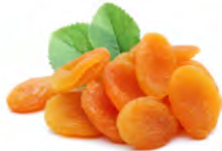
Dried Apricot مشمش مجفف Origin: Turkey