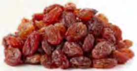
Red Raisins زبيب أحمر Origin: China, Turkey

Al-Jameel provides dried fruits to its customers of all kinds, with different packing systems and weights that suit the requirements of the local and international market.