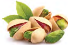
Pistachio فستق Origin: U S A, Turkey With shell & Kernel