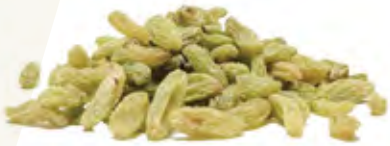
Green Raisins زبيب أخضر Origin: India, China