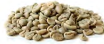
Coffe قهوة Origin: Ethiopian