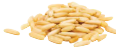
Pine Nuts الصنوبر Origin: Pakistan, Chinese