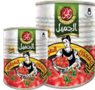
معجون طماطم Tomato Paste Origin: Itali

٤٠٠ ج x ١٢ الكرتون ٩,٦ كيلو 400g x 12 CARTON 9.6kg 2.5kg x 6 CARTON 15kg ٢,٥ كيلو x ١٢ الكرتون ٣٠ كيلو