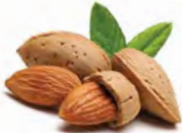
Almonds لوز Origin: U S A With shell & Kernel

Nuts products from Al Jameel are distinguished by their high quality and distinctive taste, as we take into account the storage conditions of each type in relation to temperatures, humidity and other conditions that do not lose these products to their pleasure. We deal with nuts according to the latest international technologies that the consumer deserves in the end, as nuts is produced and packed in different sizes and different packing systems to suit all sectors.