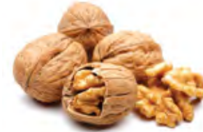
Walnut جوز Origin: U S A, China, Chile With shell & Kernel