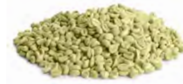
Coffe قهوة Origin: Arabiac