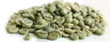
Coffe قهوة Origin: Robusta