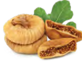
Dried Figs تين مجفف Origin: Turkey