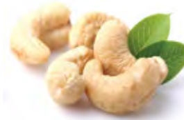
Cashew كاجو Origin: India, Vietnam W180 | W240 | W320 | W 450 | LWP SW180 | SW 240 | SW 320 | SW 450 | L SP