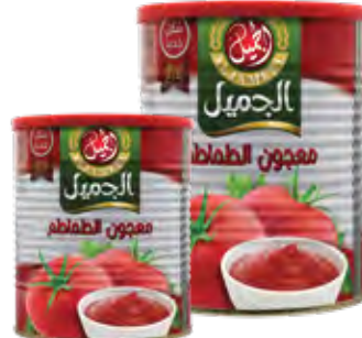
معجون طماطم Tomato Paste Origin: China

٨٣٠ x ١٢ ج الكرتون ٩,٩٦٠ كيلو 830g x 12 CARTON 9,960kg