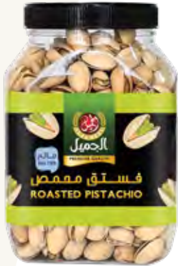
فستق محمص Roasted Pistachio Origin: USA

Al Jameel offers a family of nuts that are roasted, grilled and packed in the country of origin to preserve their quality and distinctive taste, including roasted pistachios and roasted cashews, which have a unique taste.