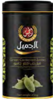
هيل حب Cardamom Origin: Guatemala

٢٠ x ٢٠ الكرتون ٢,٥ كيلو 125x20 CARTON 2.5kg