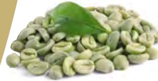
Coffe قهوة Origin: Brazilian

We select the best types of coffee from around the world, and we have a long experience in this field, so we will not give up being at the forefront with our ambition to be the largest importer of coffee in the Kingdom of Saudi Arabia, as we have already achieved this in other products. We offer Harari and Luqmati coffee to the local market under "Al Jameel" brand according to the highest quality standards in this field, with different packaging systems and sizes that suit the market's requirements in all its sales channels.