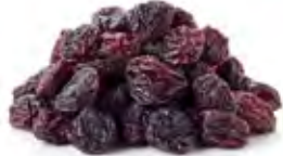
Black Raisins زبيب أسود Origin: USA, Chile, Uzpakistan