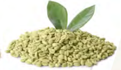
Coffe قهوة Origin: Chinese