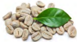
Coffe قهوة Origin: Vietnamese