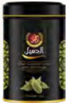
هيل حب Cardamom Origin: Guatemala

We are distinguished in importing, exporting and trading cardamom in general. We are always at the forefront in dealing with this important product. We offer the local and international market the finest types of cardamom according to the highest quality standards in this field with different packaging systems and sizes that suit the market requirements in all its sales channels.