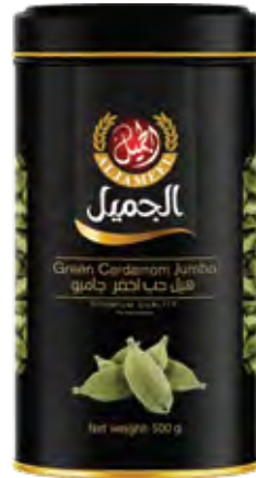
هيل حب Cardamom Origin: Guatemala

٢٠ x ٢٠ الكرتون ٢,٥ كيلو 250x10 CARTON 2.5kg