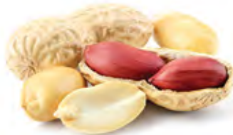
Peanut الفول السوداني Origin: India, China With shell & Kernel