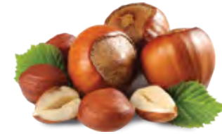
Hazelnut بندق Origin: Turkey, Georgia With shell & Kernel