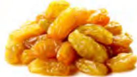
Gold Raisins زبيب ذهبي Origin: Uzpakistan, USA, India, South Africa, Chile